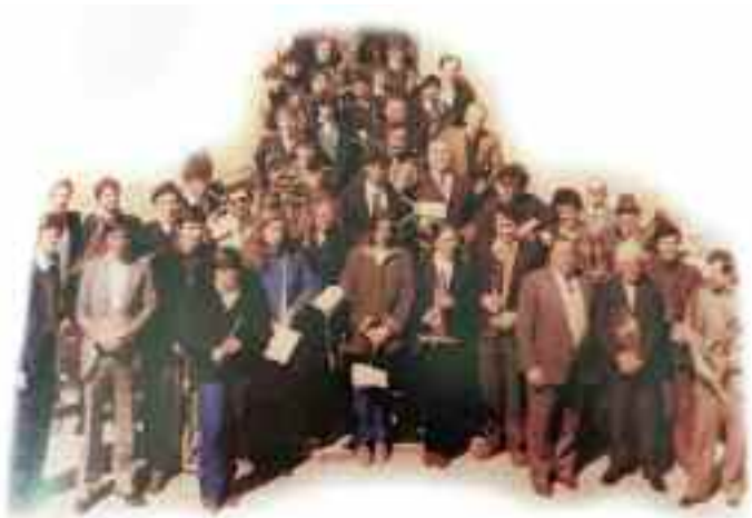
1979 - Banda Sociale Mori Brentonico